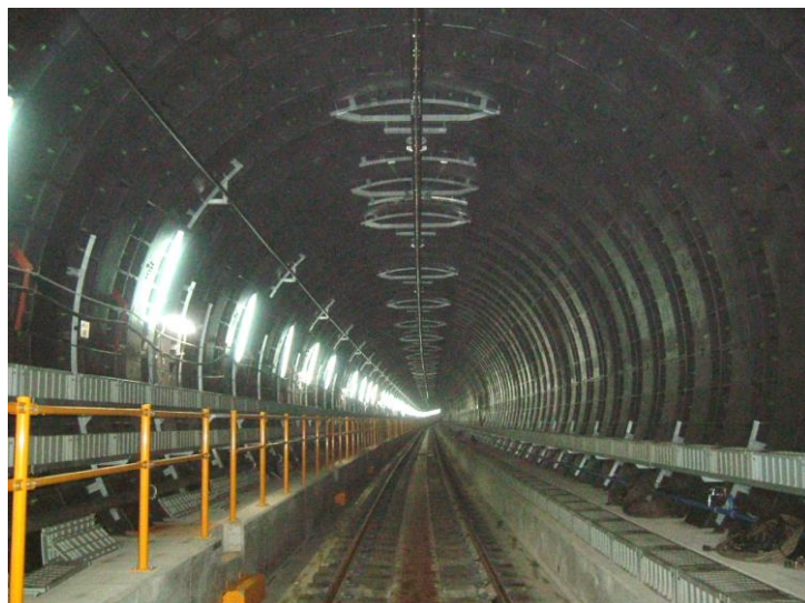
なにわ橋駅～天満橋駅間 シールドトンネル

また、なにわ橋駅～天満橋駅間のシールドトンネル部分では上町断層を横切りますが、ダクタイル(鑄鉄)セグメントを使用することにより、想定しうる変位においてはトンネルが破壊しないことを確認しています。