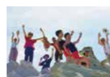
6月5日(ラテン)出演者