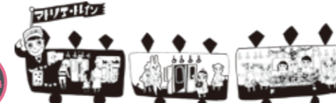
イラスト：酒井沙織

樟葉駅発の貸切電車内で「みんなの駅美術館」出展アーティスト指導のもと、電車の網棚等内装を利用して「バラ」・「橋」を制作します。仕上がった作品の一部は「みんなの駅美術館」で展示します。